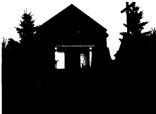
Kaplica w otoczeniu zieleni