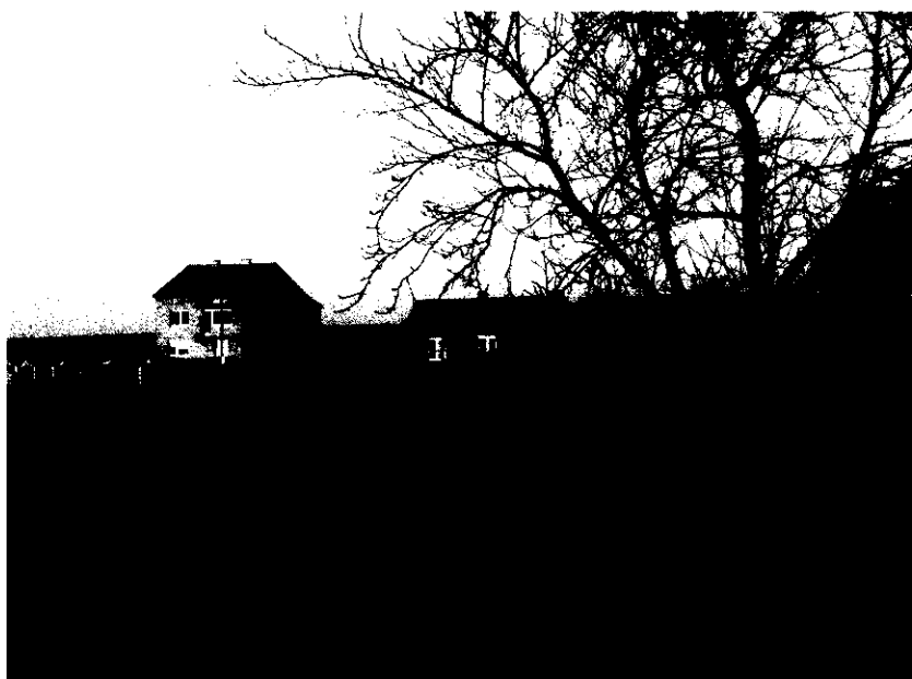
Widok na przysiółek Kurzaków

Mzurowa liczy 542 osoby zamieszkujące w murowanych domach (141 numerów), nie ma tu już prawie budynków drewnianych.