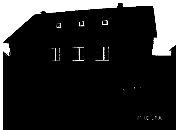
Budynek OSP w trakcie remontu i adaptacji na świetlicę.

Posiadamy natomiast kaplicę należącą do kościoła parafialnego w Mnichowie oraz budynek strażnicy wraz