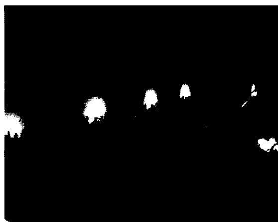
Wnętrze kaplicy z licznymi obrazami