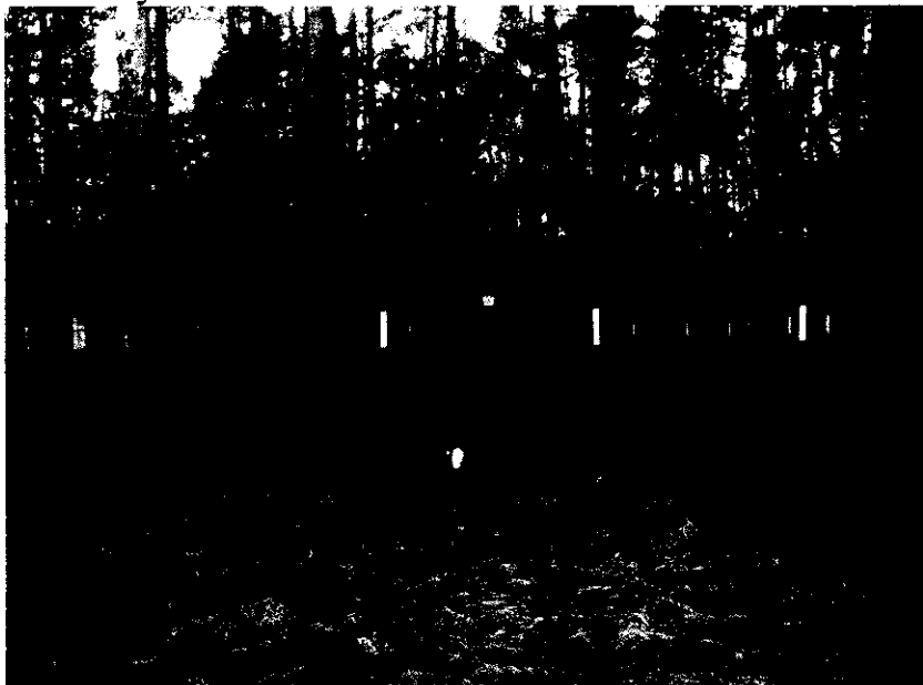
Cmentarz wojenny z lat 1914-1915

Jest jeszcze jedna pamiątka z okresu międzywojennego – murowany krzyż na kamiennym postumencie z 1931 roku, miejsce spotkań kobiet w majowe wieczory.