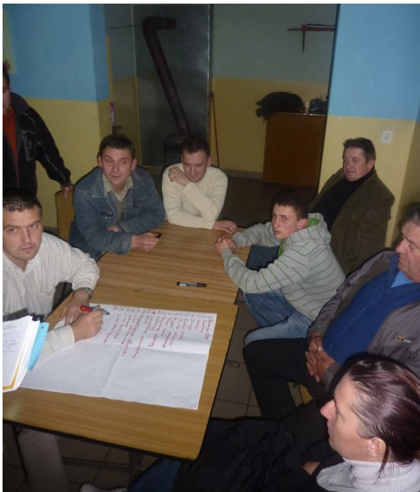
Zdjęcie nr 1 . Debata strategiczna 04.11.2010 r.

Łącznie w dyskusji wzięło udział 24 osoby.