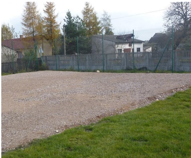
Zdjęcie nr 9. Boisko obok świątlicy wiejskiej.