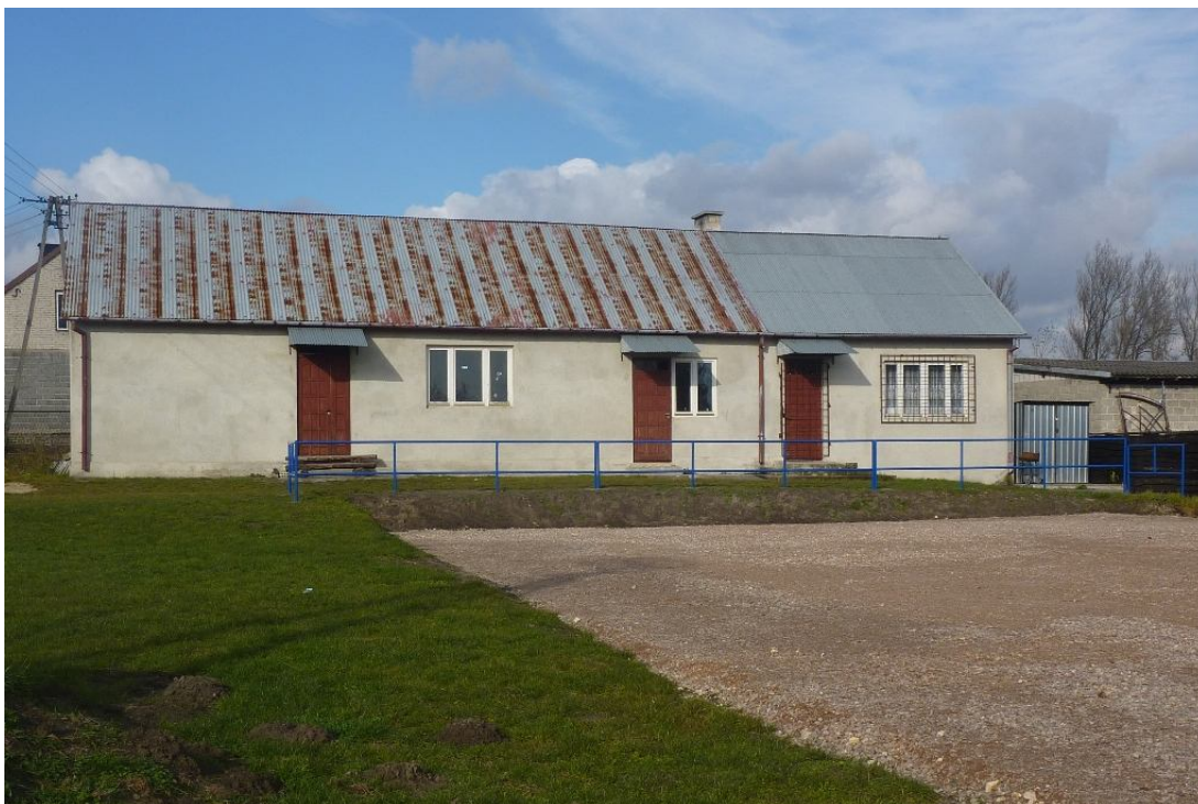
Zdjęcie nr 8. Remiza OSP/ świetlica wiejska