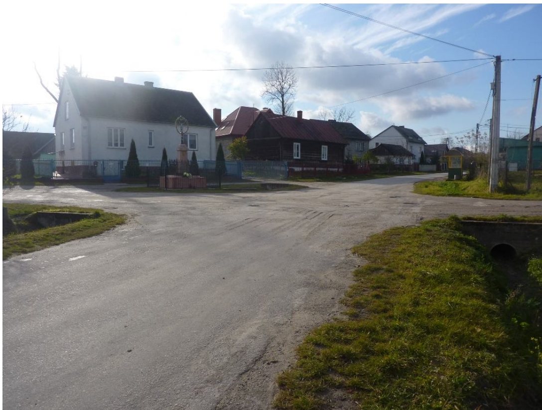
Zdjęcie nr 4. Układ przestrzenny ulic

Układ przestrzenny wsi wskazuje na typ wielodrożnicy z zarysowanym centrum miejscowości , czyli dużej miejscowości o zwartej lub luźnej zabudowie, powstająca wzdłuż kilku ciągów komunikacyjnych (ulic), ale o nieregularnym kształcie. Tereny przeznaczone pod zabudowę są uzbrojone w wodociąg i elektrykę. W miejscowości dominuje budownictwo typu małomiasteczkowego. Przeważają budynki parterowe oraz dwukondygnacyjne w układzie wolnostojącym.