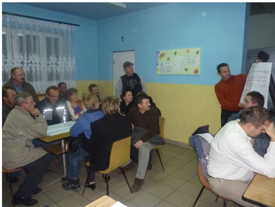
Zdjęcie nr 3 . Debata strategiczna 04.11.2010 r.