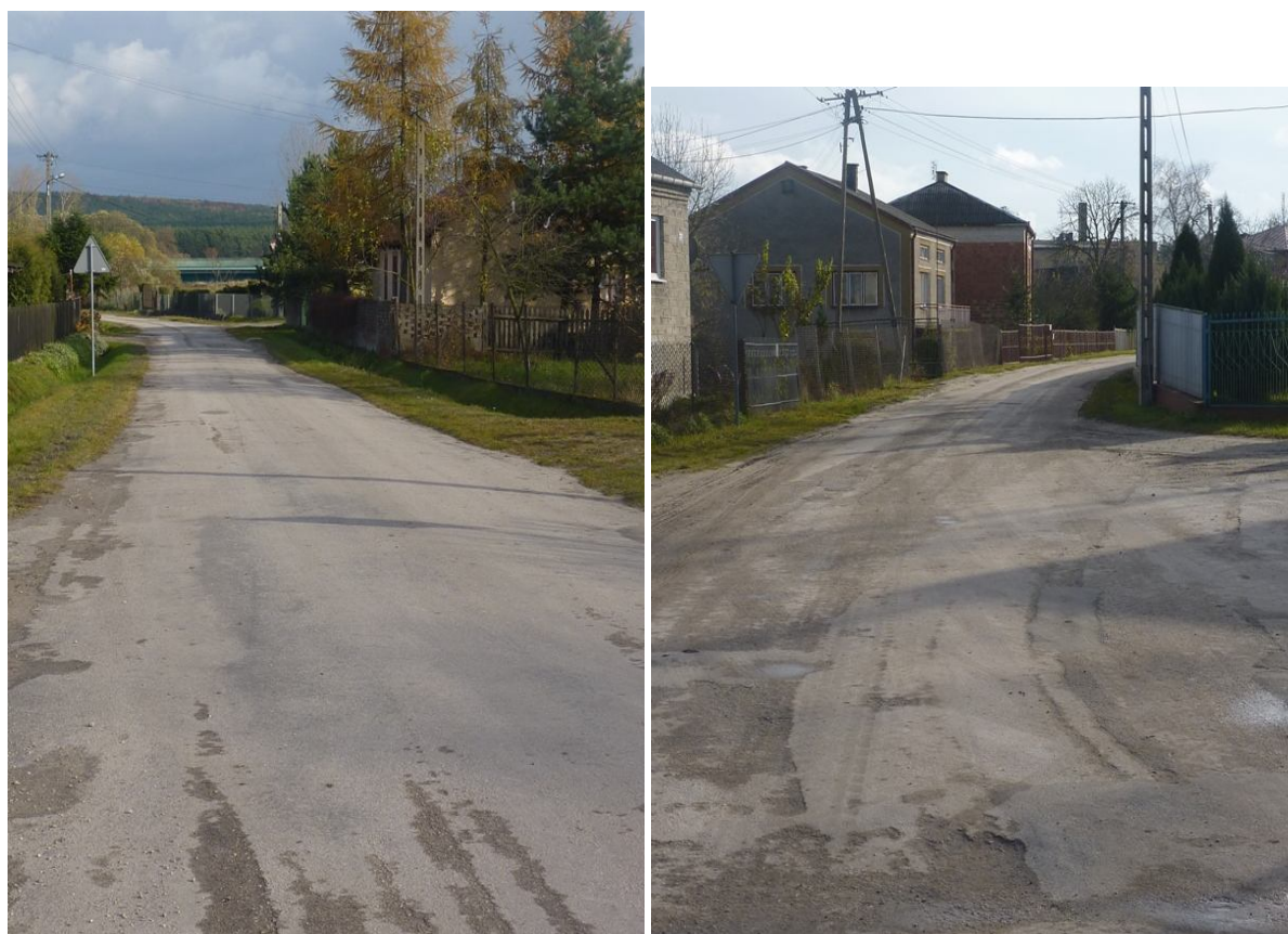
Zdjęcie nr 10. Drogi we wsi Brzeźno