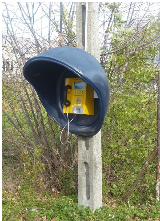
Zdjęcie nr 12. Budka telefoniczna

W zakresie telekomunikacji, miejscowość obsługuje automatyczna centrala telefoniczna TP S.A., łącząca telefony z siecią krajową. Powszechne jest również korzystanie z usług telefonii komórkowej. Mieszkańcy mają również dostęp do Internetu zarówno drogą radiową jak i poprzez łącze TP. W Brzeźnie znajduje się również punkt telefoniczny publicznego dostępu.