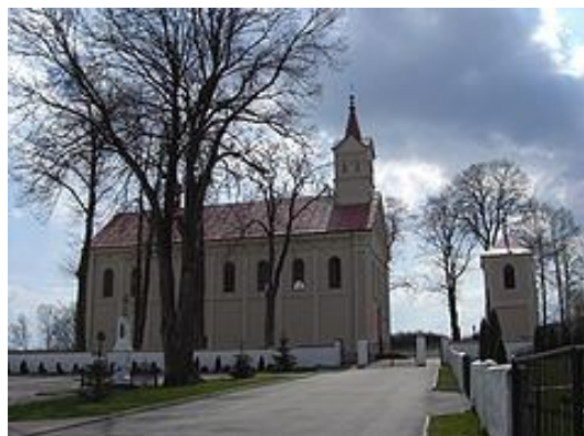
Zdjęcie nr 6. Kościół w Brzegach do którego należą mieszkańcy Brzeźna

Cenną atrakcją turystyczną znajdującą się w jej pobliżu jest kościół znajdujący się w Brzegach do którego należą mieszkańcy Brzeźna.