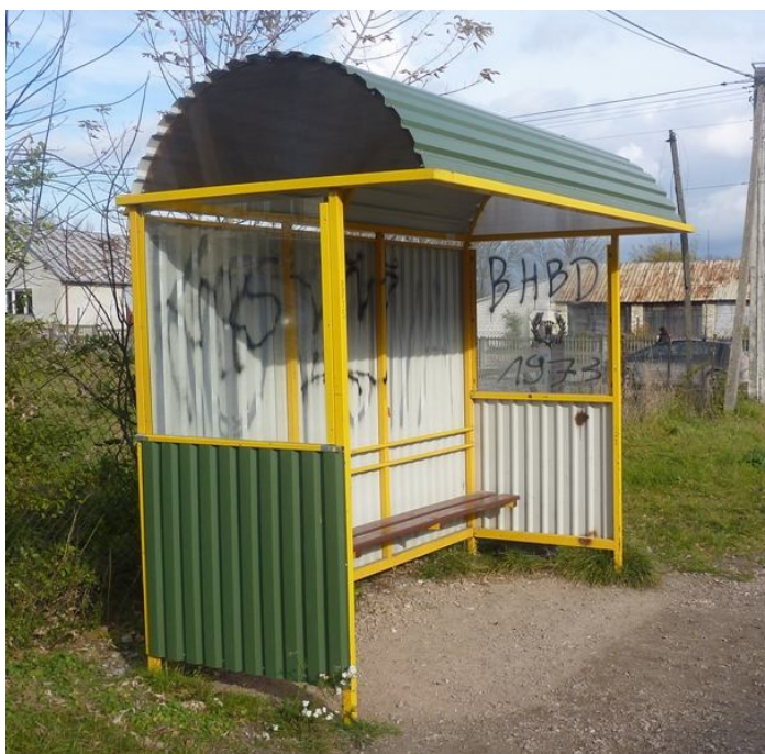
Zdjęcie nr 11. Przystanek autobusowy w miejscowości Brzeźno

Przez miejscowość przebiega także linia kolejowa (most kolejowy na rzecze), brak jest jednak przystanku kolejowego.