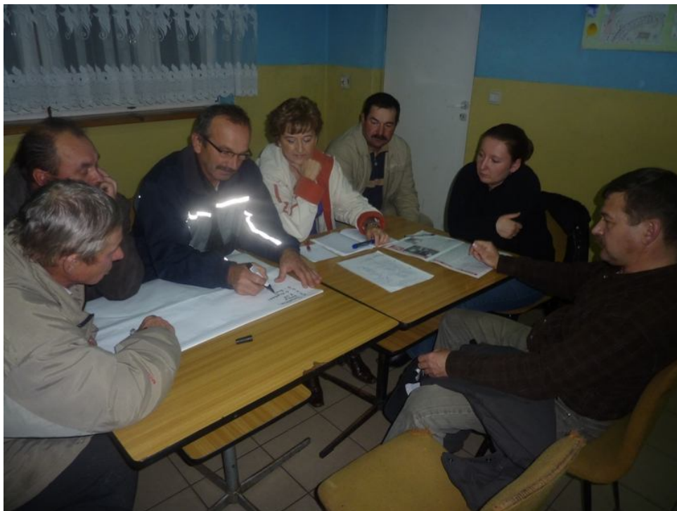
Zdjęcie nr 2. Debata strategiczna 04.11.2010 r.