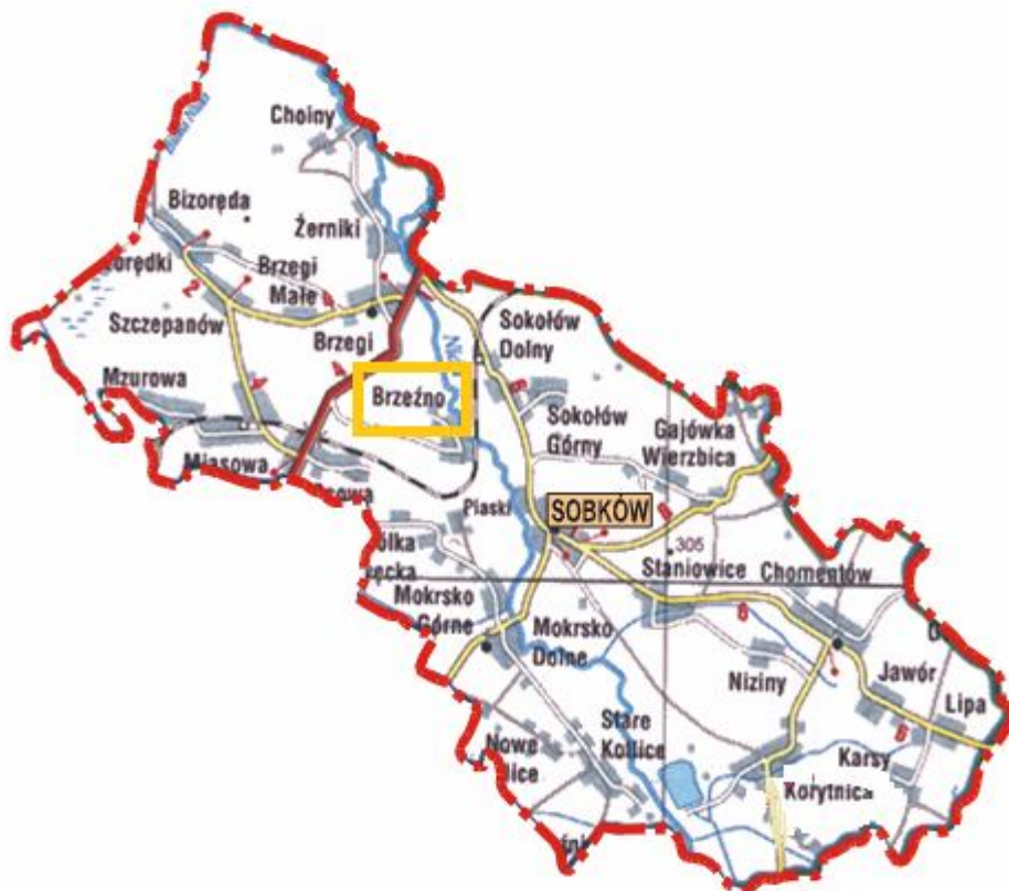
Miejscowość Brzeźno na tle gminy Sobków

Brzeźno jest jednym z sołectw Gminy Sobków. W Gminie zlokalizowane są następujące sołectwa (25): Bizoreda, Brzeźno, Brzegi, Choiny, Chomentów, Jawór, Karsy, Korytnica, Lipa, Miąsowa, Mokrsko Dolne, Mokrsko Górne, Mzurowa, Niziny, Kotlice Nowe, Osowa, Sobków, Sokołów Dolny, Sokołów Górny, Staniowice, Kotlice Stare, Szczepanów, Wierzbica, Wólka Kawęcka, Żerniki.