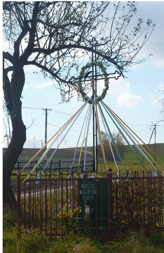
Zdjęcie nr 7. Przydrożne krzyże