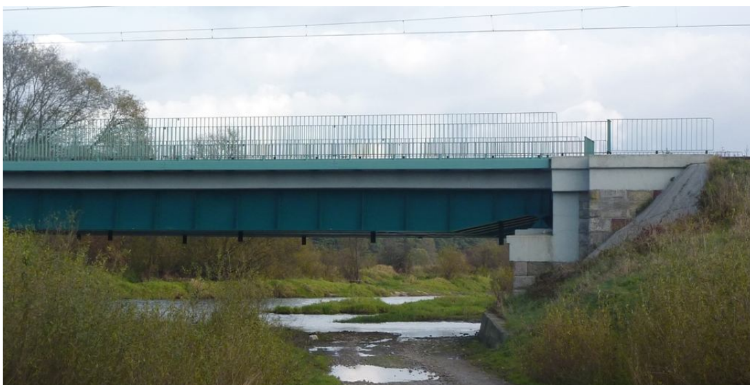
Zdjęcie nr 5. Rzeka Nida w miejscowości Brzeźno.

punkcie, w okolicach Motkowic 79 m. Głębokość rzeki waha się od 0,4 do 2,6m. Jest to jedna z najcieplejszych polskich rzek. Temperatura wody w lecie dochodzi do 27°C. Ważniejsze miejscowości położone nad Nidą to Sobków, Pińczów, Chroberz, Wiślica, Nowy Korczyn. Główne dopływy to Brzeźnica, Mierzawa. W Nidzie występuje dużo odmian ryb takich jak: krap, okoń, sum, płoc, jaź, leszcz, szczupak, wzdreaga, świnka, brzana, sandacz, certa, karp, kleń i ukleja. Nida to wspiana rzeka do wędkowania, letnich kąpieli, spływów kajakowych itp.