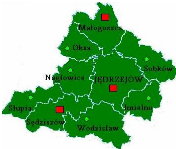
Powiat Jędrzejowski – mapa

Gmina Sobków położona jest w centralnej części województwa świętokrzyskiego, w powiecie jędrzejowskim. Zajmuje północną część powiatu jędrzejowskiego, sąsiadując bezpośrednio z gminami: